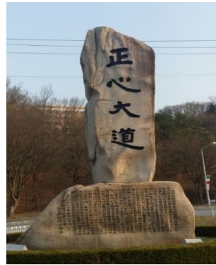
글로벌캠퍼스 정심대도 (正心大道)탑 건립 (1986.4.20)