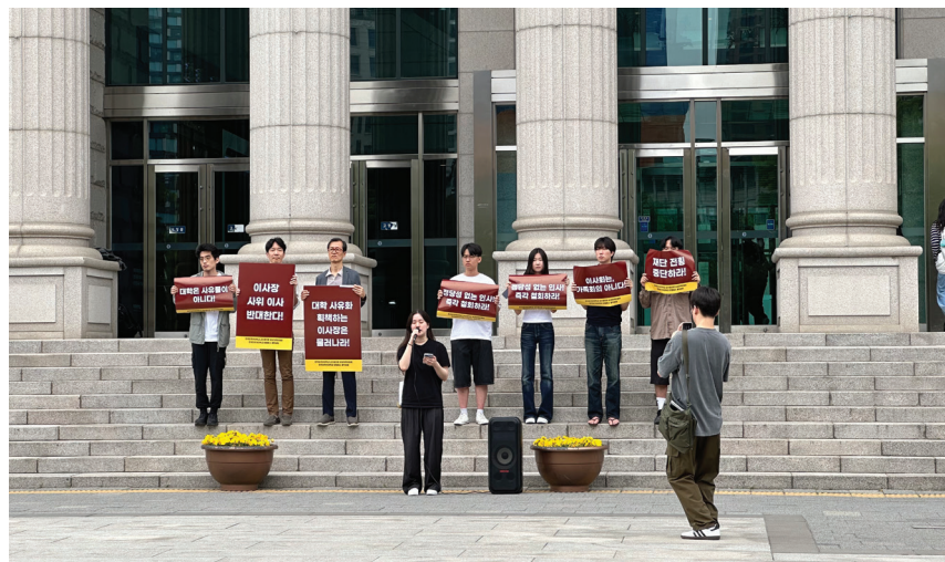
거친 뒤 선임 절차를 진행하는 방안에 참석이사 8인이 전원 동의하였다. 이에 설캠 제60대 총학생회 선명은 차기 이사회인 제4차 이사회가