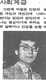
이 홍 략