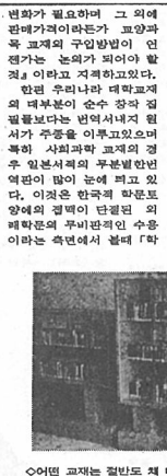
○이런 교재는 원본도 채 부족 못하게 평가된다.

최근 교재는 원본도 채 부족 못하게 평가된다. 학생처는 생활운영을 위해 2학기 구제검토를 하고 있다. 학생처는 생활운영을 위해 2학기 구제검토를 하고 있다. 학생처는 생활운영을 위해 2학기 구제검토를 하고 있다.