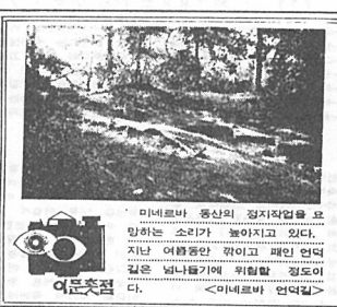
마네르바 동산의 정치교육을 요망하는 모습과 함께 하고 있다.

제 288호 <순간> 1979년 9월 21일 발행 등록 1969년 7월 1일 창간 1955년 4월 11일