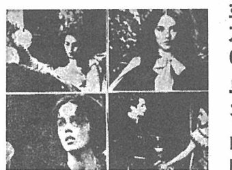
영화 '사랑의 영장회'의 한 장면. 주인공들이 서로를 바라보는 모습이다.

영화감독 프랑소와 트뤼포의 작품은 매우 다양하다. 그는 인간의 감정과 욕망을 그려내는 데 능숙하다. 그의 작품은 현대인의 내면 세계를 탐구하는데 있어 중요한 위치를 차지하고 있다. 트뤼포의 대표작 중 하나인 '사랑의 영장회'는 주인공의 사랑과 인생의 좌절에 대한 이야기를 다루고 있다. 이 작품은 프랑코 포에티와 리얼리즘 영화의 영향을 받은 것으로 보인다.