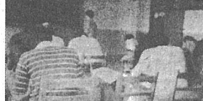
○ 지난 10일 기말고사가 종료되어 따라 캠퍼스는 활기 넘치는 분위기이다.