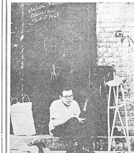
촬영방법의 소용돌이에서 방황한 청년이여. 이 그림에서 '나중에서' 촬영하면 어떠하겠는가. 그래서 Peter Zuria의 Nikon FTM105mm Lens ASA400.